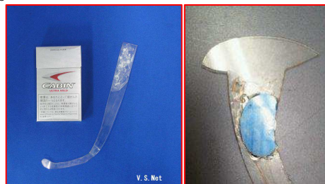
北電子現行筐体クレマン