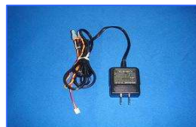
専用 AC アダプター (40 台迄接続可能)