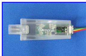
CPU 内蔵クランプセンサー