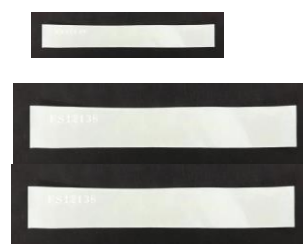
改ざん防止 番号付き 透明封印シール 3枚付属