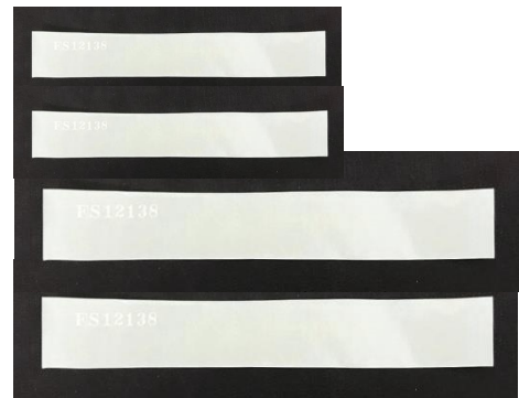
番号付き透明封印シール付属